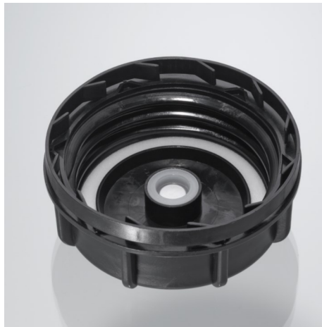
Kanisterverschluss KV61 neutral Mit Entgasung