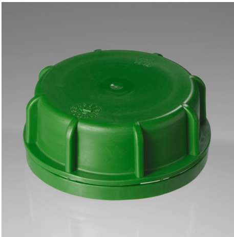
Kanisterverschluss KV61 neutral